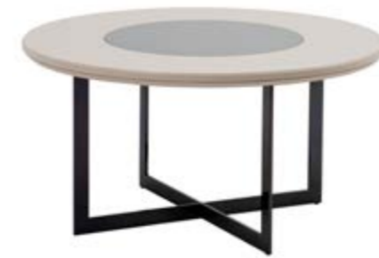
ORTA SEHPA/ COFFEE TABLE G/W:91 Y/H:60 D/D:91