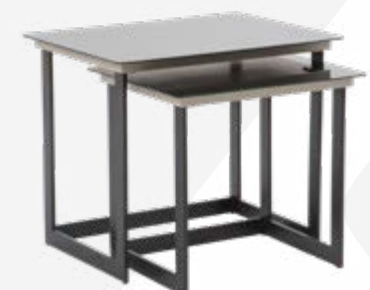
ZİĞON SEHPA/ SIDE TABLE G/W:60 Y/H:50 D/D:45